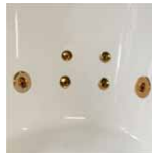
Adjustable jets gilded Jets orientables dorés