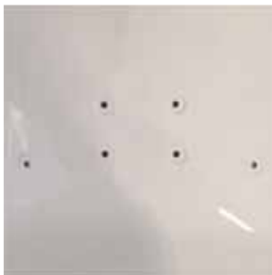
Fixed jets colour of bath Jets fixes couleur baignoire