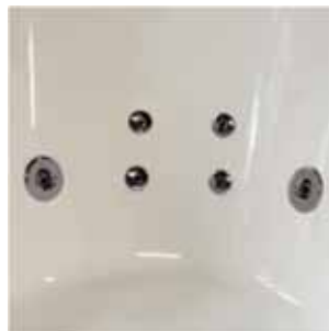
Adjustable jets chromed Jets orientables chromés